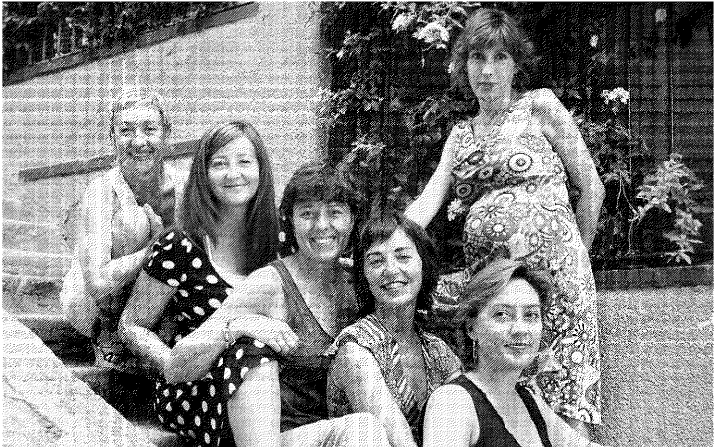
Les sis actrius que han format part de la companyia al llarg dels seus quinze anys d'existència.

presència · Del 10 al 16 de novembre del 2006